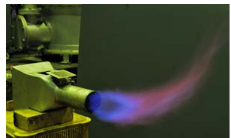
図7. 精製ガスの燃焼状況