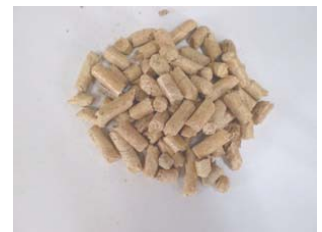
図3. 木質系ペレット