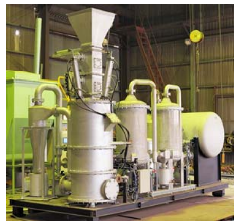
図4. ガス化装置全景