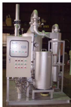
図8. TN型廃液処理装置(左) と 図9. 木質ペレット焚き温風機

前述の技術を活用して、木質バイオマスの燃焼熱を利用した食品排液、コンクリート排液等を噴霧乾燥させる「TN型廃液処理装置」(図8. 参照)や、農産物栽培ハウスおよび家畜・養鶏場の暖房に利用できる「木質ペレット焚き温風機」(図9. 参照)等の注目される商品を開発・販売しており、国内の報道機関、企業・法人および団体からの見学も後を絶たない。