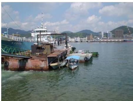
図1-2. 「てっぱん」撮影栈橋